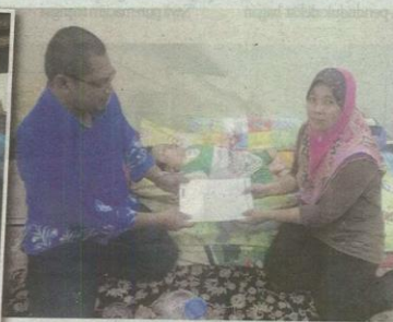
Membantu penerima yang memiliki anak menghidap masalah kesihatan antara sasaran utama.